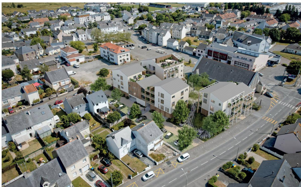
Projection - Image non contractuelle © Spectrum immersive architecture – BertinBichet Architectes

Dans un contexte de marché immobilier en tension, Saint-Nazaire Agglomération lance « Puissance 4 », un projet innovant de construction hors-site pour répondre aux besoins croissants en logements et maîtriser davantage les délais et les coûts de production. Lauréate du dispositif « Démonstrateurs de la ville durable », opéré par la Banque des Territoires pour le compte de l'État dans le cadre de France 2030, l'Agglomération s'entoure d'acteurs publics et privés pour proposer des logements collectifs de qualité, à la fois durables, abordables et respectueux de l'environnement. La livraison prévisionnelle du premier programme dans le centre-bourg de la commune de Trignac, site d'accueil du « Démonstrateur », est prévue fin 2026.