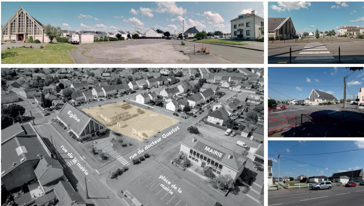
Centre-bourg de Trignac

Grâce à sa desserte par un bus à haut niveau de service mettant le cœur de bourg à 10 minutes du centre-ville de Saint-Nazaire et son foncier disponible, le centre-bourg de Trignac est un espace privilégié pour produire une offre de logements abordables. Le site dont le maître d'ouvrage est CISN accueillera 32 logements et environ 400 m 2 de surface commerciale.