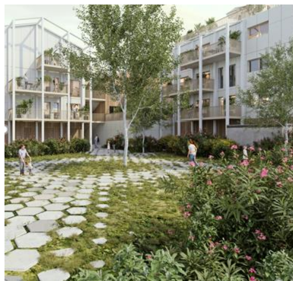
Projection - Image non contractuelle © Spectrum immersive architecture – BertinBichet Architectes